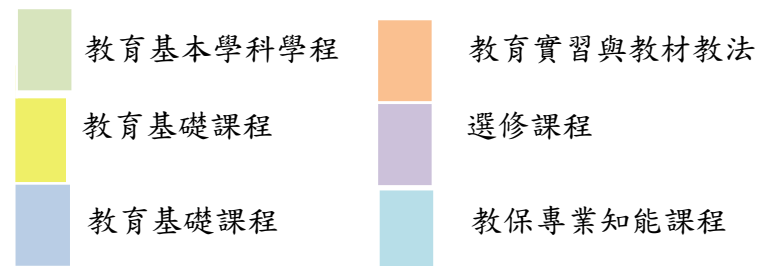
師資培育中心幼教學程學生職涯進路地圖